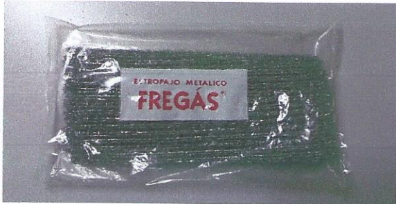
ESTROPAJO ESPECIAL PAELLAS

Registro Industria N.º 46/54.007 Registro Sanitario N.º 37.01307/V R.O.E. y S.B. N.º 0714-CV Almacén R.O.E. y S.B. N.º 0022-CV