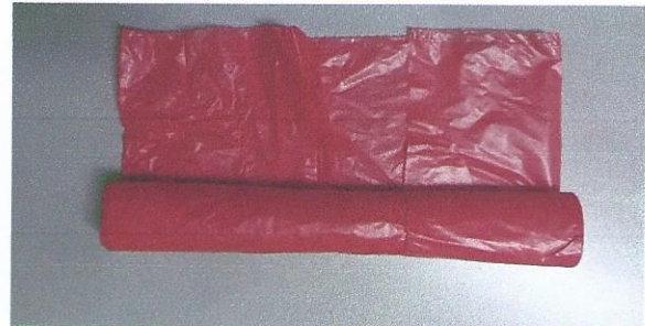
BOLSA BASURA DOM 52X60 20 Uni