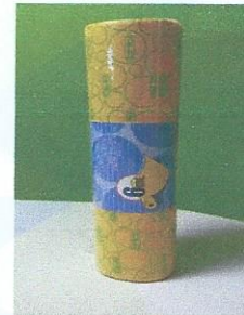
BALLETA 6 metros